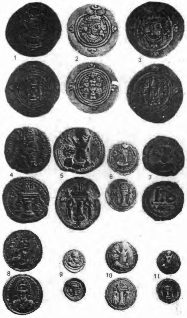
نمونه ی (۴)